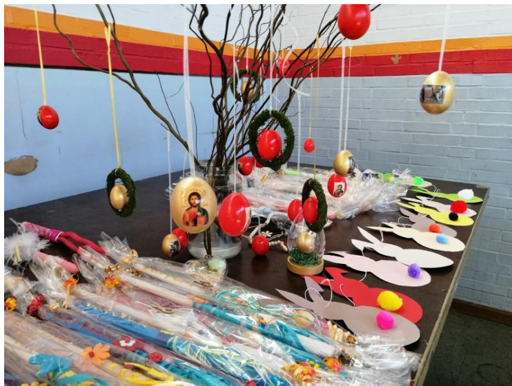
Πασχαλινή εκδήλωση Συλλόγου Γονέων